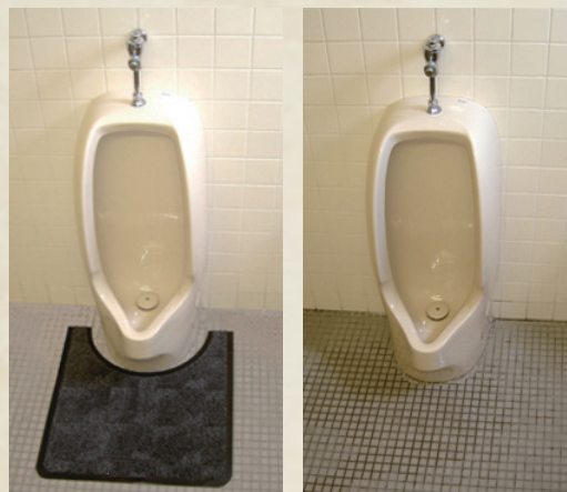
トイレマットを使用していない場合、跳ね返りや汚れが目立ってしまっています

トイレ内の悪臭は「尿石」が起因していることが多く、男性便器では便器内だけでなく、尿の跳ね返りで床が濡れてしまっている状態をよく見かけます。尿が腐敗してアンモニアが発生し悪臭となります。また、タイルに付着した黄褐色の汚れが尿石です。これも悪臭の原因となり、見た目にも良くありません。